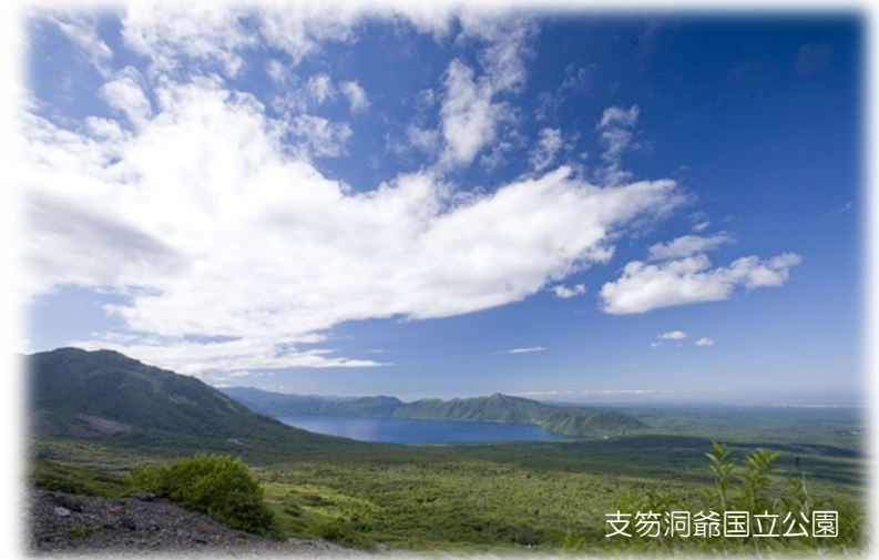
支笏洞爺国立公園